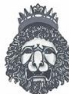
ENOTECA DE'GIUSTI Via Giuseppe Giusti, 2/r – Firenze